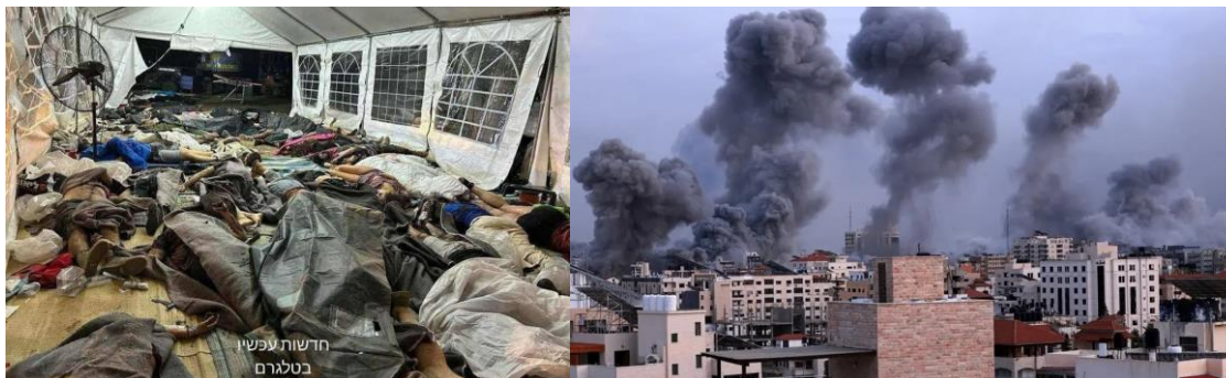
بمباران غزه توسط نیروی هوایی اسرائیل و کشتار غیرنظامیان در اسرائیل توسط حماس

واشنگتن که هر سال ۳/۸ میلیارد دلار کمک نظامی به اسرائیل ارائه می‌کند هم‌چنین اعلام کرد که به زودی تجهیزات جدید دفاع هوایی، مهمات و سایر کمک‌های امنیتی را به این کشور خواهد فرستاد.