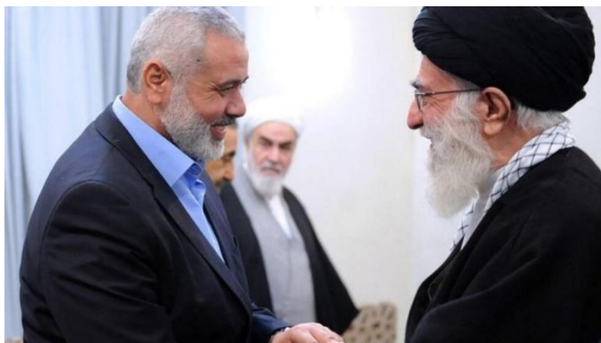
اسماعیل هنیه و علی خامنه‌ای

از طرف دیگر، در روزهای اخیر یک عضو ارشد حماس در تهران گفته بود که عادی‌سازی روابط اسرائیل با کشورهای عرب منطقه «مهم‌ترین تهدید» برای فلسطینی‌هاست. به گزارش صداوسیما جمهوری اسلامی، اسامه حمدان عضو حماس روز دهم مهر ماه در نشست عمومی «کنفرانس بین‌المللی وحدت اسلامی» در تهران گفته بود: «مهم‌ترین تهدیدی که در حال حاضر برای فلسطین وجود دارد، این است که رژیم صهیونیستی به دنبال عادی‌سازی روابط با کشورهای مختلف است.» او با تأکید بر این که «عادی‌سازی روابط با رژیم صهیونیستی ظلمی در حق همه فلسطینی‌هاست» افزود: «باید در برابر چنین طرحی با ایستیم و مقاومت کنیم.» در همان زمان، علی خامنه‌ای رهبر جمهوری اسلامی ایران در دیدار با سفرای کشورهای اسلامی، گفته بود «قمار عادی‌سازی روابط» با اسرائیل «سراسر باخت است» و «اسرائیل رفتنی است.» این اظهارات در حالی مطرح شد که عربستان ظرف یک هفته میزبان دومین وزیر اسرائیل بود و آمریکا به دنبال عادی‌سازی روابط ریاض و تل‌آویو است.