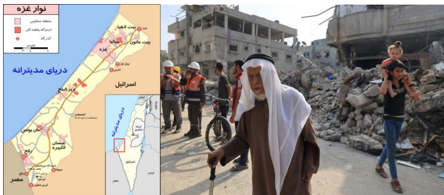
۸ اکتبر ۲۰۲۳، جنوب نوار غزا، پس از یک حمله هوایی اسرائیلی