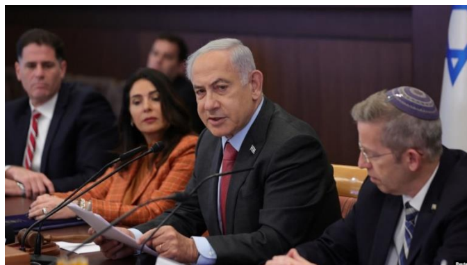
نشست کابینه اسرائیل

نشست وزیران پست‌های حساس امنیتی، اطلاعاتی و نظامی اسرائیل، که کابینه سیاسی-امنیتی نامیده می‌شود، در نشست خود اعلام کرد انجام عملیات نظامی در وضعیت جنگ، مأموریت ارتش و تمامی نهادهای کشور است. این مصوبه مطابق با ماده ۴۰ قانون دولت‌های اسرائیل است. در بیانیه دولت در این خصوص آمده است: «جنگ در ساعت ۶ بامداد روز ۷ اکتبر (۱۵ مهر) به‌دنبال یک حمله تروریستی مرگ‌بار از نوار غزه آغاز و به اسرائیل تحمیل شد.»