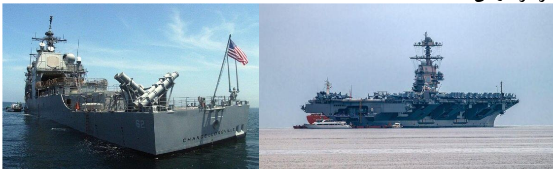
آمریکا می‌گوید ناو هواپیمابر «یواس اس جرال آر فورد» را به اسرائیل نزدیک‌تر می‌کند

وزارت بهداشت غزه اعلام کرده است ۴۱۳ نفر از جمله ۷۸ کودک و ۴۱ زن در این منطقه کشته شدند. حدود ۲۰۰۰ نفر از هر طرف زخمی شده‌اند.